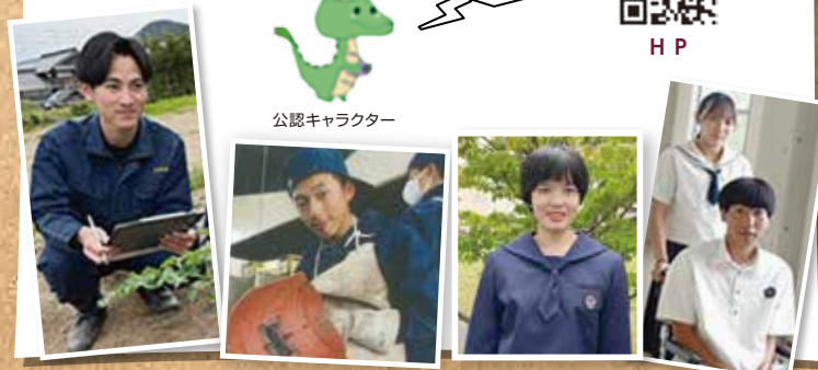
公認キャラクター